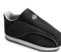
All Round Shoe