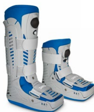
AirTraveler Walker Achill

Na szczególną uwagę zasługuje jedyny na rynku walker na kikut powstały po małej amputacji w obrębie przodostopia.