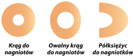
Krąg do nagniotów

Stosuje się je przy niewielkich skaleczeniach stopy bądź też w końcowej fazie procesu leczenia, gdy nie ma już konieczności wycinania indywidualnych kształtów odciążer. Oferowane w opakowaniach zawierających 72 sztuki danego produktu.