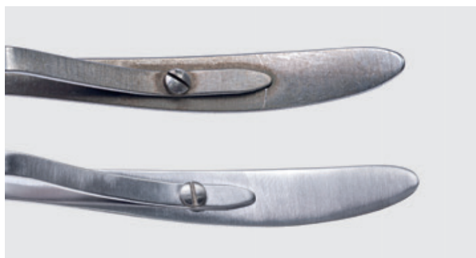
■ Demontaż i naprawa lub wymiana sprężyn, wymiana części zamiennych (sprężynki i wkręty)