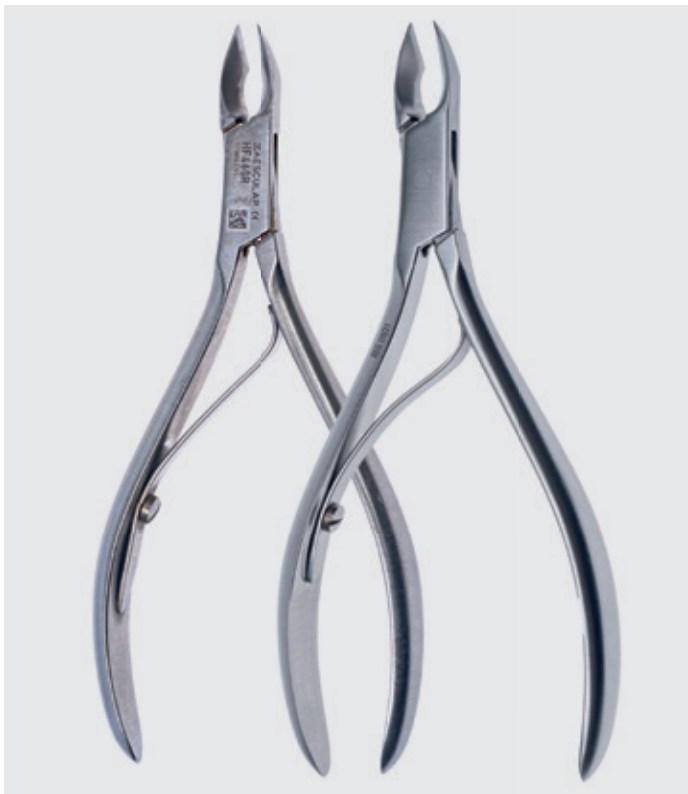
■ Odnowienie całej powierzchni czązek