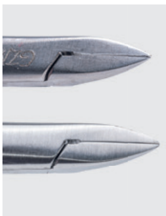
■ Usuwanie deformacji części pracującej czązek, które powstały na przykład po upadku czązek na podłogę.