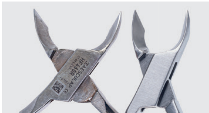
■ usuwanie luzów bocznych